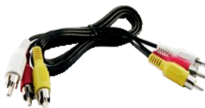
Cable RCA (Rojo y Blanco son de audio, amarillo de video)