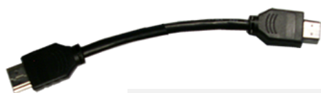
Cable HDMI permite ver los canales en HD.

Estos son los cables encargados de transmitir la señal del decodificador, al televisor.