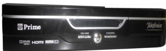
DECODIFICADOR PRIMER HD

Estos son los decodificadores HD que tenemos como parte del servicio de alta definición.