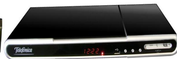
SAGEM ICAD88 HD